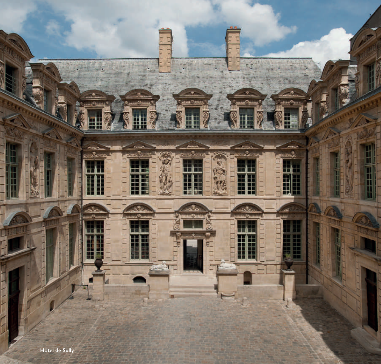
Hôtel de Sully