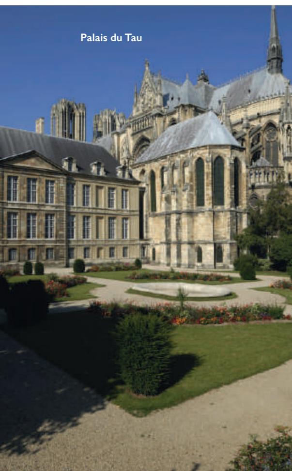
Palais du Tau

CHAPITEAU CRISTAL 190 m 2 dans l'Avant-cour 100 personnes assises (dîner et réunion) ou 150 debout (cocktail)