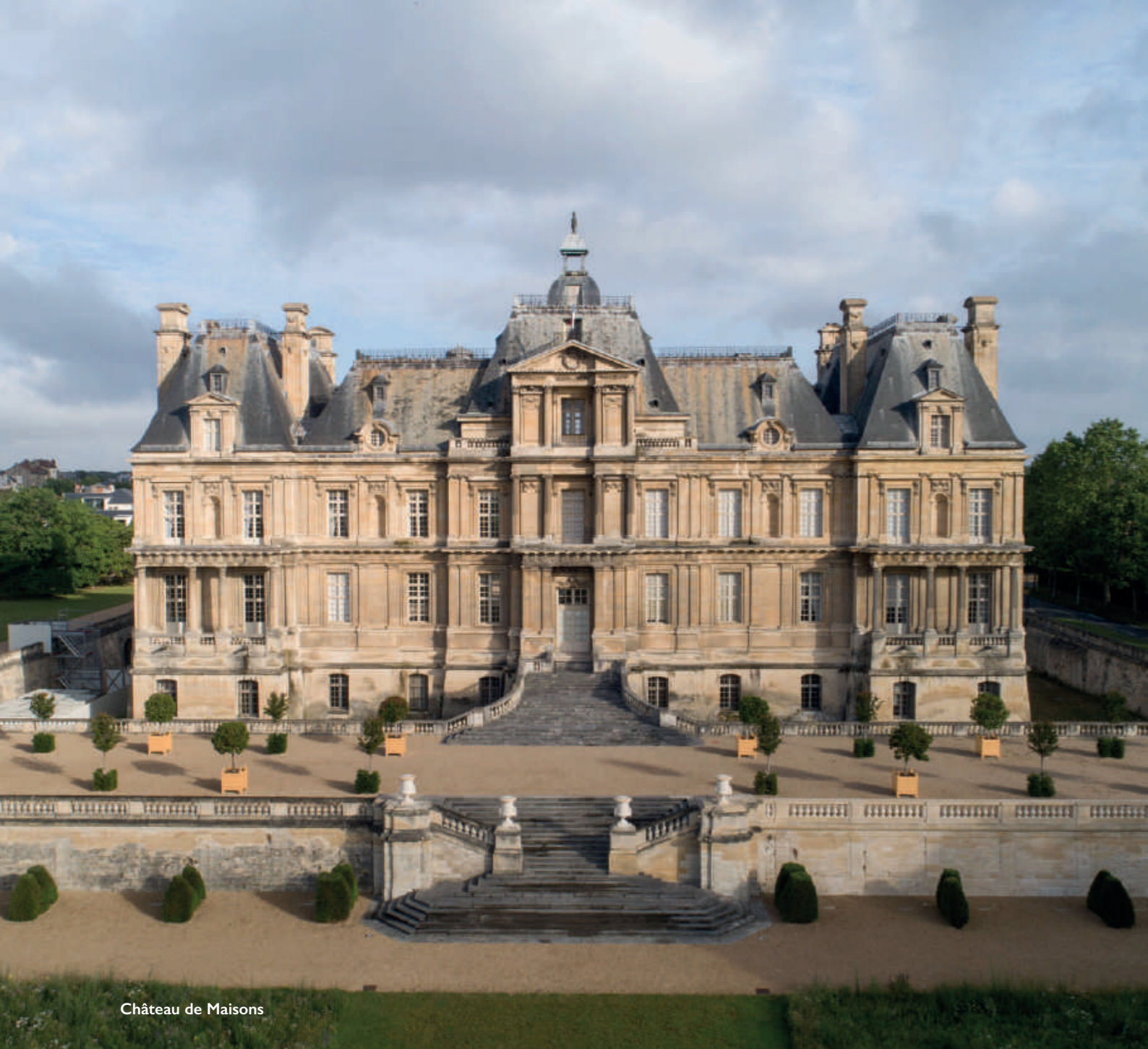
Château de Maisons

Situé aux portes de Paris et facilement accessible en RER, le château de Maisons vous offre l'opportunité d'organiser vos événements dans un véritable chef-d'œuvre du XVII e siècle.