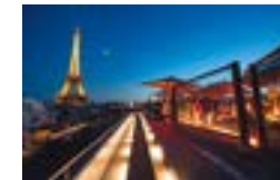
2 Le restaurant Les Ombres (sur le toit)