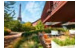
3 Le café Jacques