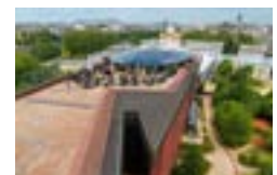
7 La terrasse panoramique