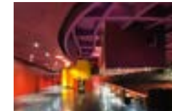
1 Le théâtre Claude Lévi-Strauss