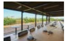
5 La salle Jacques Friedmann (au-dessus du mur végétal)