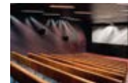
4 La salle de cinéma