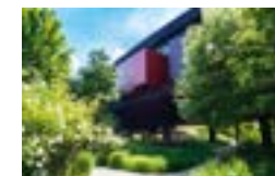
6 Le jardin