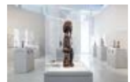
9 La galerie jardin (espace d'exposition temporaire)