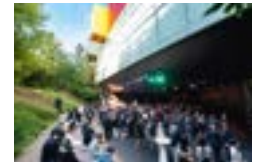
Le théâtre de verdure