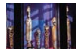
8 Le plateau des Collections